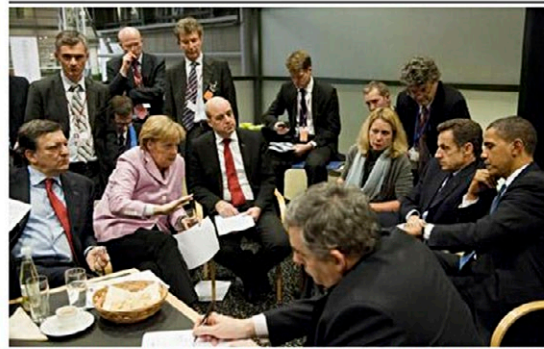
The committee to save the world: Barack Obama, Nicolas Sarkozy, Angela Merkel, Gordon Brown and other leaders at the Copenhagen climate talks